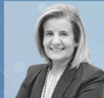
Fátima Báñez Presidenta Fundación CEOE