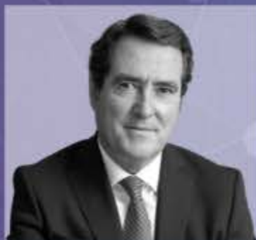
Antonio Garamendi Presidente CEOE